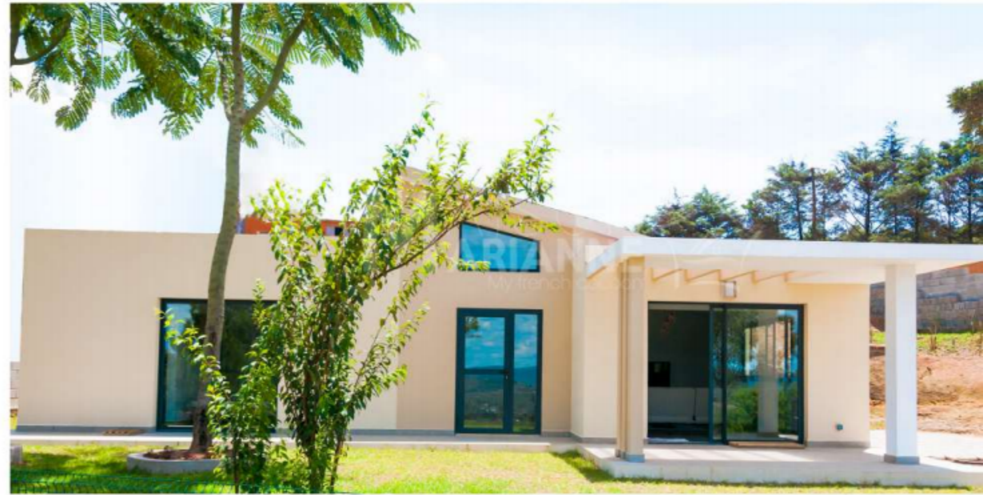
Photo réelle - Villa F4