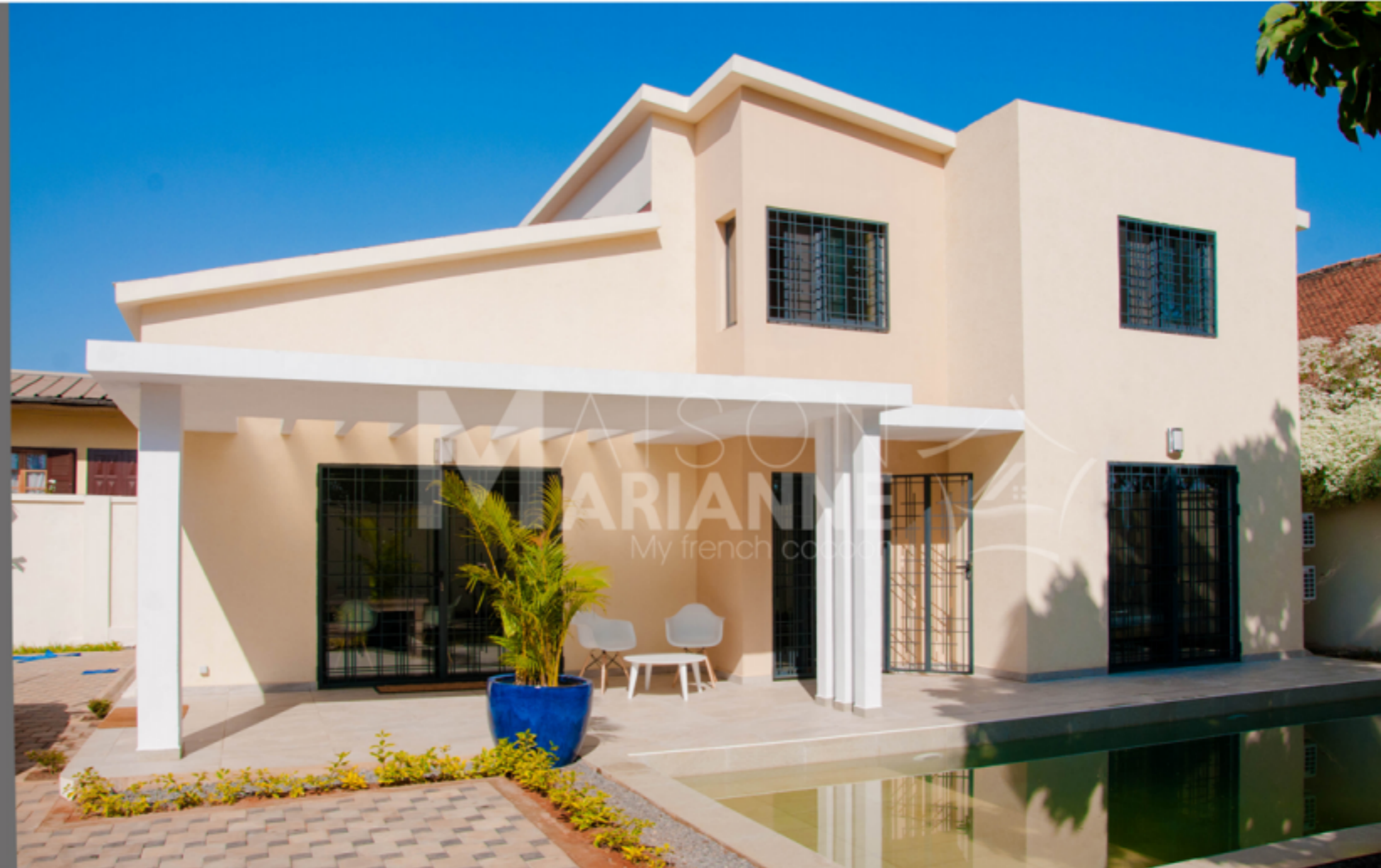
Photo réelle - Villa F5

Un environnement dans lequel vous pourrez vous épanouir : lumière, espace, nature